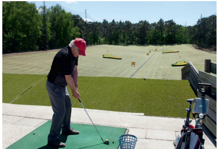
► DE DRIVINGRANGE VAN BILTSE DUINEN IS UNIEK.