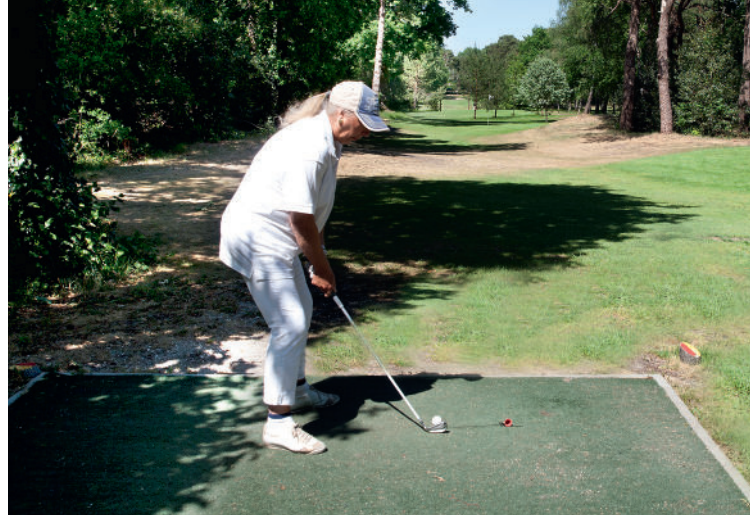
► NET ALS OP VEEL ANDERE PAR-3-BANEN IS HET ZAAK GOED OP TE LETTEN OF ER DICHT IN DE BUURT NIET IEMAND ANDERS AFSLAAT.