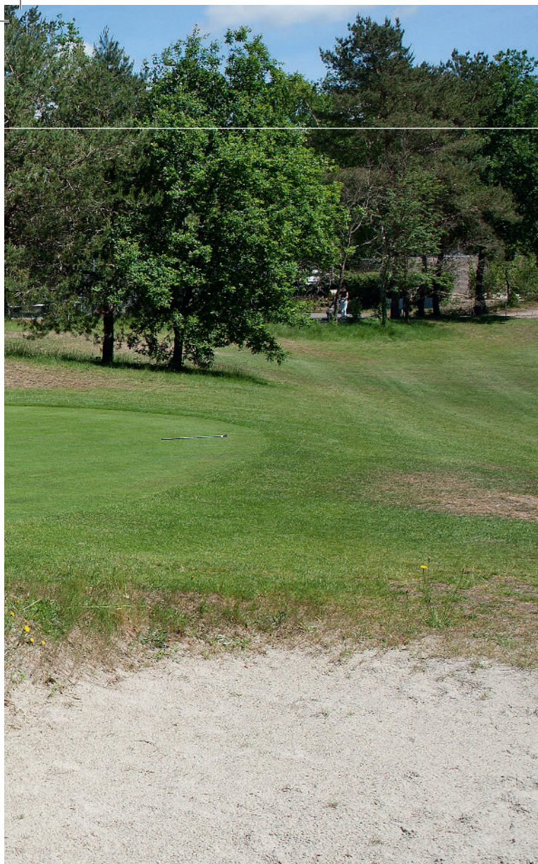
► FOTO LINKS: DE BUNKERS ZIJN NOG EEN PUNTJE VAN AANDACHT, OOK NAAST DE GREEN VAN HOLE ÉÉN.